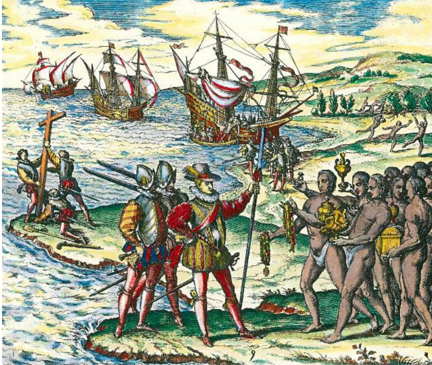
(Gravure de Théodore de Bry, XVI e siècle. BNF, Paris.)