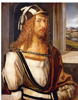
Autoportrait de Dürer (1498), huile sur toile, Musée du Prado, Madrid