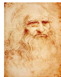
Léonard de Vinci