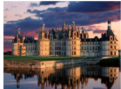
Le château fort de Chambord, situé dans la vallée de la Loire et construit à la Renaissance

En France, la Renaissance se traduit notamment par la construction de magnifiques châteaux forts le long de la Loire. François Ier fait venir Léonard de Vinci pour construire les châteaux royaux de Chambord et de Fontainebleau (reportage). Ces somptueuses demeures témoignent de l'intégration du style italien aux traditions architecturales françaises.