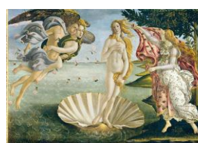
La Naissance de Vénus, Sandro Botticelli (1485)