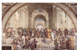
L'Ecole d'Athènes, Raphaël, 1511

Enfin, certains artistes s'inspirent aussi de scène de la vie de tous les jours dans leurs peintures.