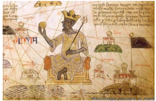
Fragment de portulan de l'atlas Catalan (XIVe siècle)

1) Remplis la fiche d'identité sur l'Empire du Mali ci-dessus. (2 points)